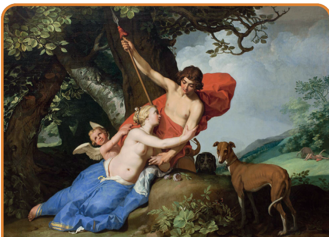
Abraham Bloemaert – Venus and Adonis OPLYSNINGSTIDEN