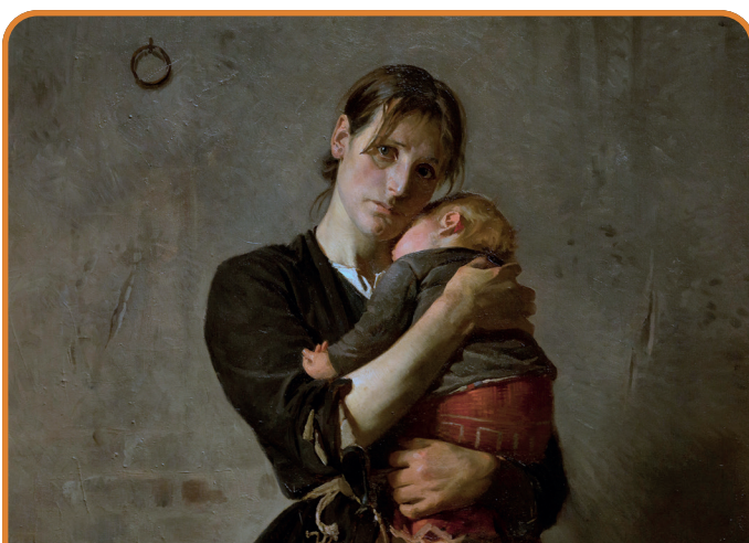
Forladt. Dog ej af venner i nøden DET MODERNE GENNEMBRUD