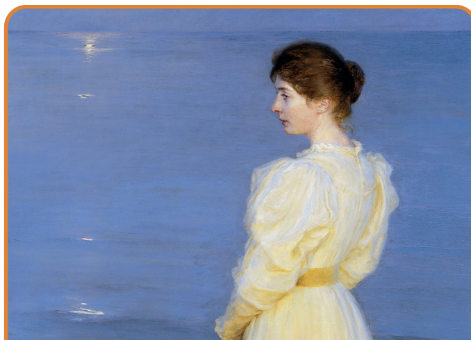
Sommeraften ved Skagen ROMANTIKKEN