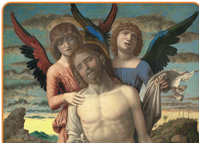
Kristus som den ledende frelser MIDDELALDER